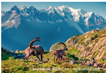
Mont Blanc

Samstag, Der Mont-Blanc-Express Gestärkt mit dem Buffet-Frühstück fahren wir heute mit der Reiseleitung mit dem Mont-Blanc-Express, dessen Trasse durch eine beeindruckende Gebirgswelt führt, an die Grenze nach Le Chatelard, wo Sie von unserem Busfahrer wieder abgeholt werden und den bekannten Wintersportort Chamonix erreichen. Sie haben dort genügend Zeit für eine Bergbahnfahrt auf den Aiguille du Midi, von wo aus Sie eine zauberhafte Aussicht auf den höchsten Berg Europas, den Mont Blanc, genießen können. Oder fahren Sie mit der Zahnradbahn das Eismeer von Montenvers bestaunen. Nach dem freien Aufenthalt geht es wieder zurück ins Hotel. Abendessen.